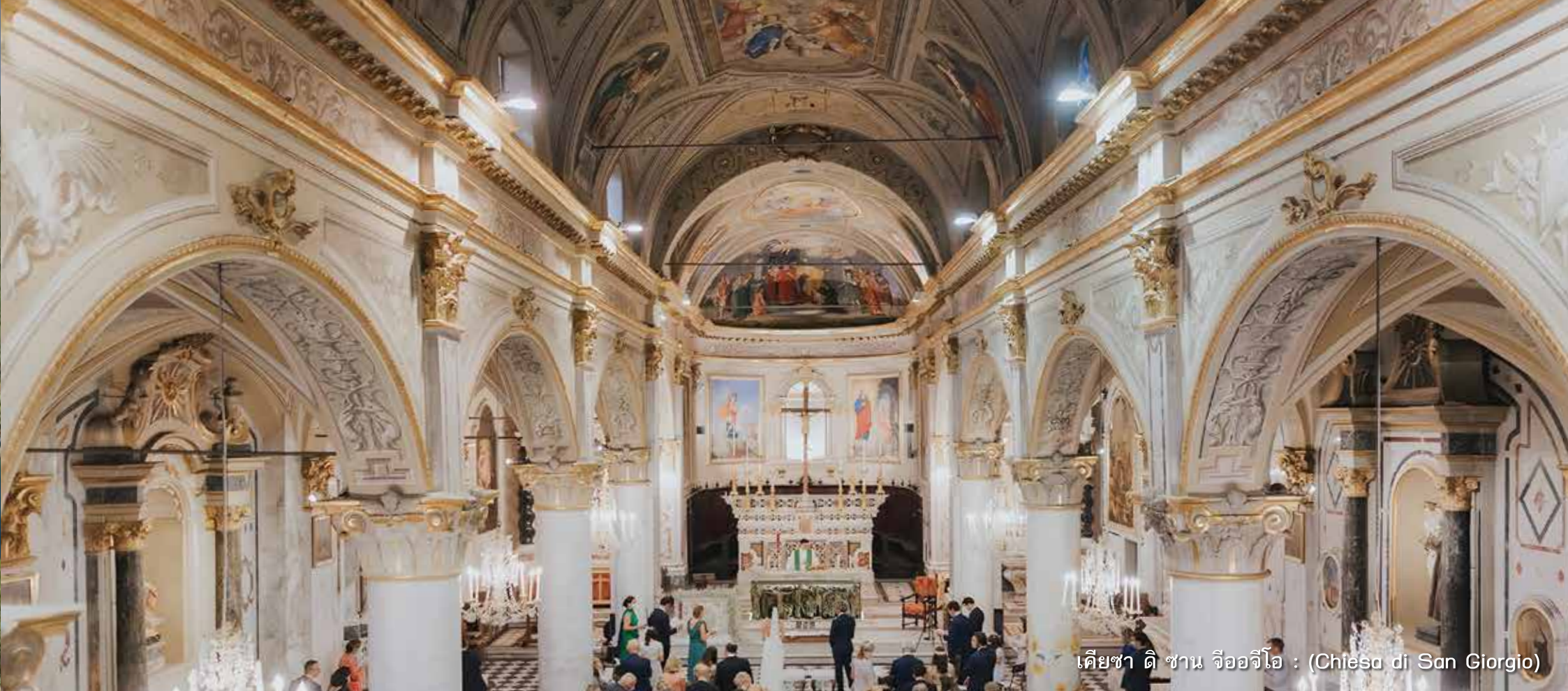
เคียซา ดิ ซาน จีออจีโอ : (Chiesa di San Giorgio)