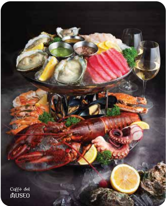
Caffè del Museo