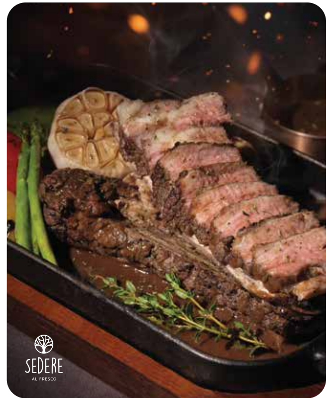
Sedere al Fresco