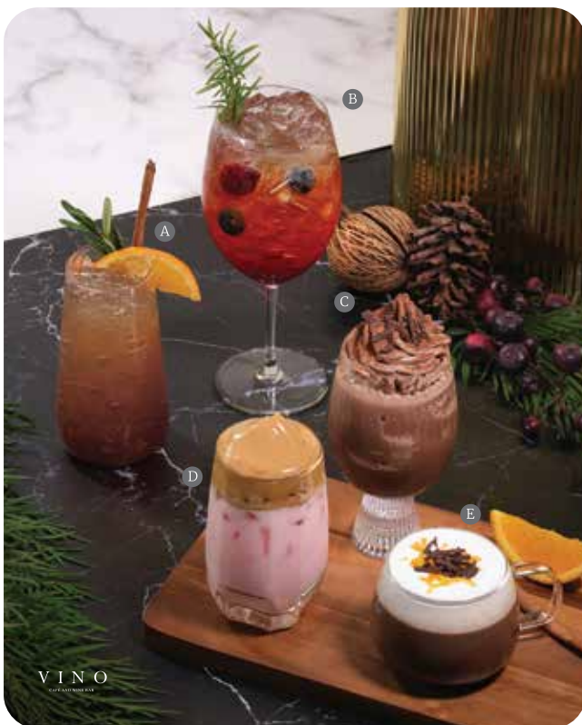
Vino Café and Wine Bar