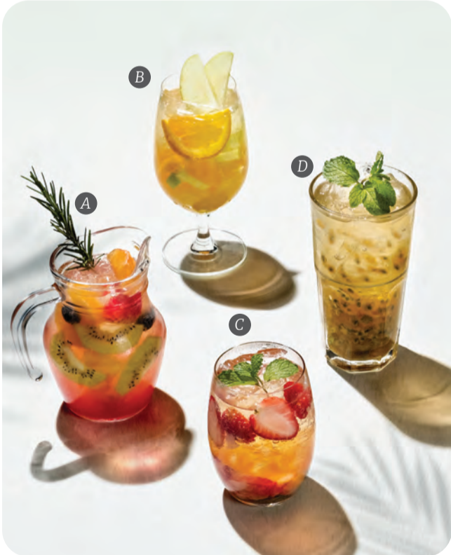
4. VINO รังสรรค์เครื่องดื่มจากรสชาติของทรอปิคอลฟรุต ให้คุณได้ชาร์จพลัง เติมความสดชื่นพร้อมที่จะออกไปเก็บประสบการณ์ใหม่ ที่สถานานาวัลเล่แห่งนี้