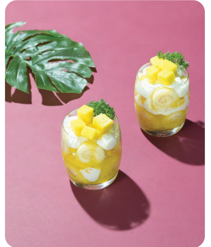
6. Mango custard trifle

ทริแยเฟิลคัสตาร์ดมะม่วง นำผลไม้แบบทรอปิคอลอย่างมะม่วงมาทำเป็นแยมทานคู่กับคัสตาร์ด มีสปอนจ์เค้กรสมะม่วงที่ผสมผสานรสชาติให้อร่อยกลมกล่อม ทานพร้อมเนื้อมะม่วงสุกให้คุณได้ปิดมื้ออาหารด้วยความสดชื่น