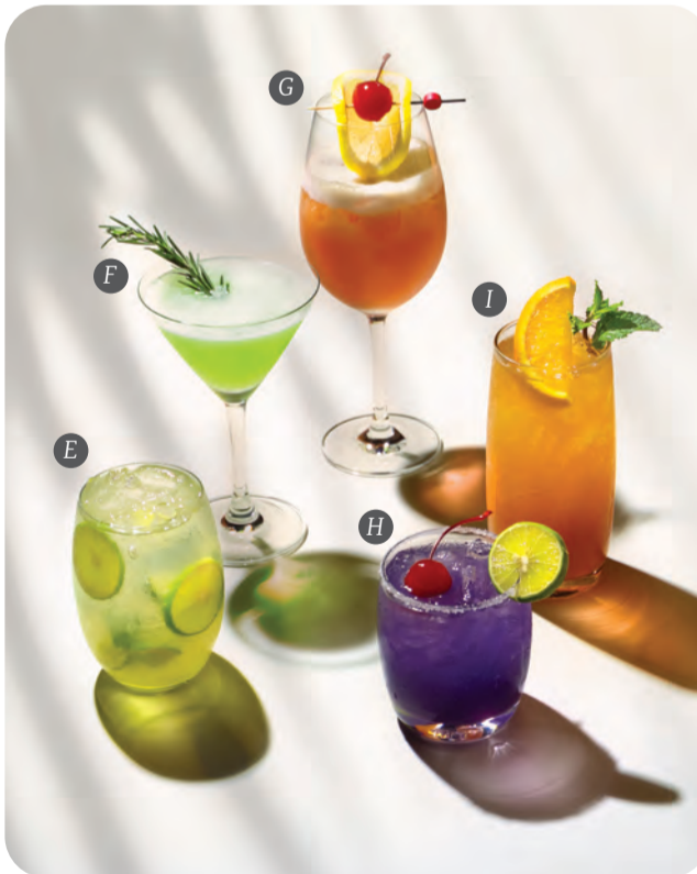
5. Cocktail คัดสรรผลไม้ของประเทศเขตร้อน อาทิ เสาวรส กล้วย มะนาว สับปะรด ผสมผสานกับเหล้าชั้นดีกลายเป็นค็อกเทลสดชื่นคลายร้อนในช่วงซัมเมอร์นี้