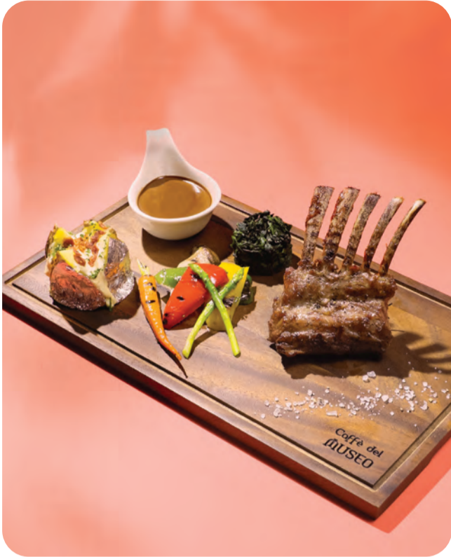
1. Grilled Veal Rack served with red wine sauce, grilled vegetables and mashed potato

เนื้อลูกวัวย่างเสิร์ฟพร้อมซอสไวน์แดง ผักย่างและมันบด เชฟจากห้องอาหารอิตาลี Caffè del Museo คัดสรรเนื้อลูกวัวชิ้นดีนำมา ตุ๋นเครื่องเทศจนเข้าเนื้อ ได้เนื้อนุ่มชุ่มฉ่ำทานคู่กับซอสไวน์แดงรสชาติ กลมกล่อม ถือเป็นงานพิเศษสุดในช่วงซัมเมอร์นี้