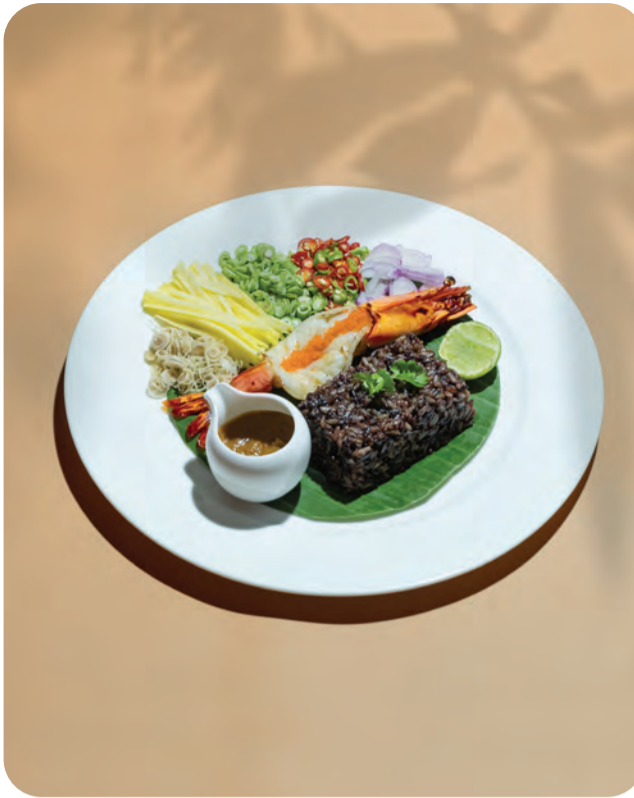
2. Shrimp-paste fired Rice served with giant tiger prawn & Thai side dish

เนื้อลูกวัวย่างเสิร์ฟพร้อมซอสไวน์แดง ผักย่างและมันบด เชฟจากห้องอาหารอิตาลี Caffè del Museo คัดสรรเนื้อลูกวัวชิ้นดีนำมา ตุ๋นเครื่องเทศจนเข้าเนื้อ ได้เนื้อนุ่มชุ่มฉ่ำทานคู่กับซอสไวน์แดงรสชาติ กลมกล่อม ถือเป็นงานพิเศษสุดในช่วงซัมเมอร์นี้