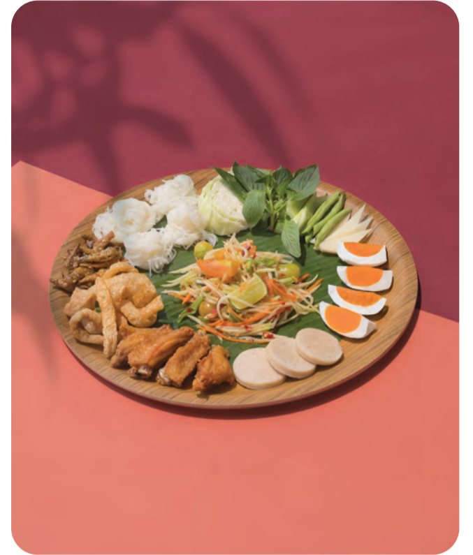
3. Mixed Papaya Salad in Tray papaya salad, Vietnamese sausage, fried pork rind, fried chicken, crispy fried fish, rice noodles, salted egg

ข้าวคลุกกะปิกุ้งลายเสือ กุ้งลายเสือดัวใหญ่ทานคู่กับข้าวคลุกกะปิสูตรเฉพาะของห้องอาหาร นานาชาติ Club Cucina พร้อมเครื่องเคียงครบรส ทำให้อาหารอร่อย ของรสชาติจานนี้ออกมาสมบูรณ์